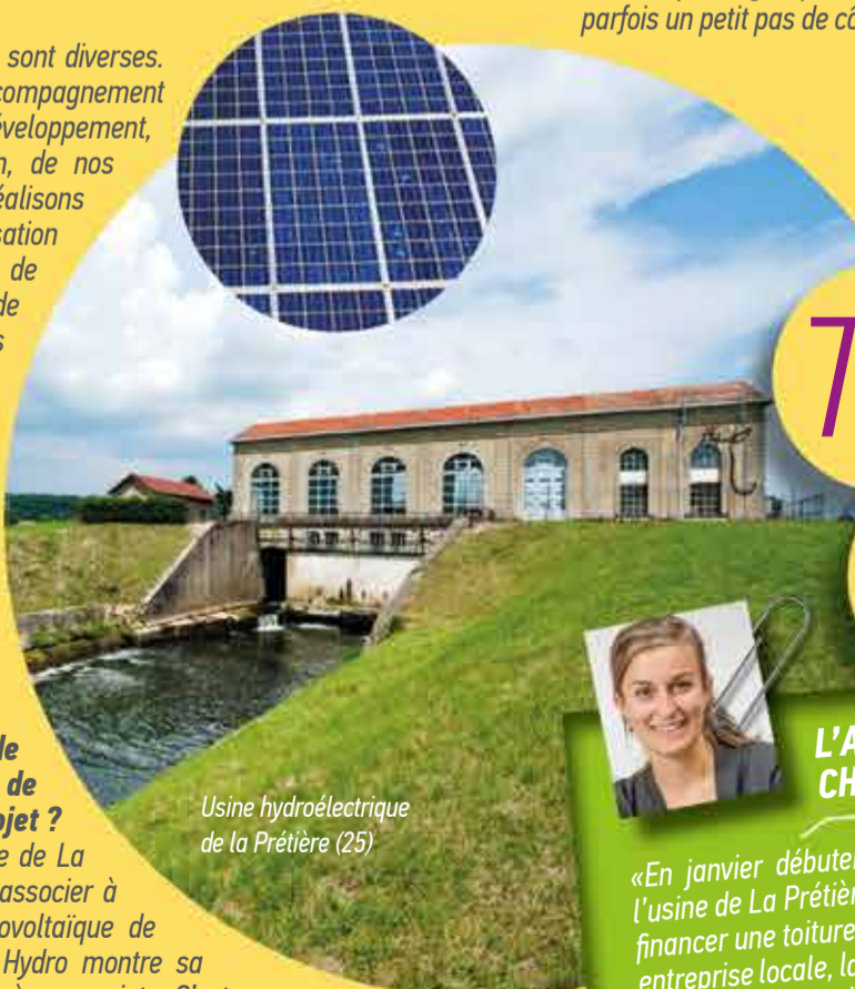
Usine hydroélectrique de la Prétière (25)

+ d'infos sur : www.fruitiere-energies.fr