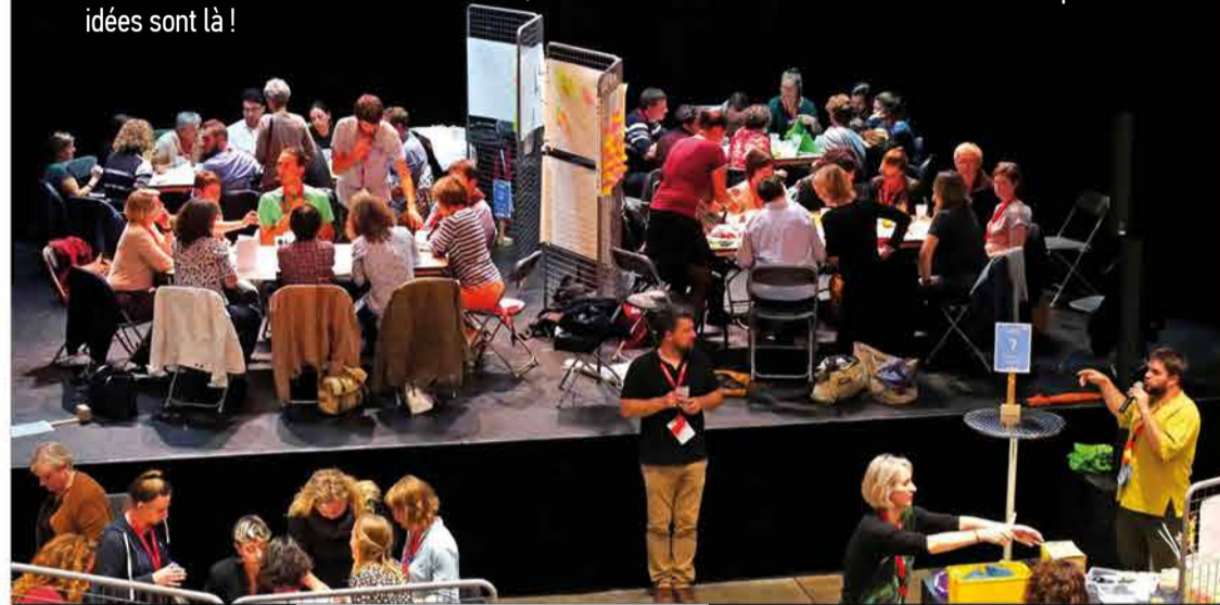
Start-Up de Territoire 3 + d'infos sur : www.startuplons.fr

Actuellement, il est vraiment difficile de recruter des salariés dans de très nombreux domaines, notamment techniques. De nombreuses démarches dédiées à l'attractivité du territoire pour accueillir de nouveaux talents émergent un peu partout sur le territoire pour répondre à cet enjeu majeur. L'agence a participé à un certain nombre d'entre elles. Par exemple : les groupes de travail sur l'emploi en Petite Montagne, le workshop « attirer et garder les talents chez nous » organisé par Made in Jura, l'atelier « Viens, on y est bien » à la Start-Up de Territoire 3 de Lons-le-Saunier organisé par le Clus'Ter Jura. Tous ces moments d'échange et de créativité autour de l'attractivité du territoire sont très riches, démontrent la difficulté de la tâche mais aussi que les idées sont là !