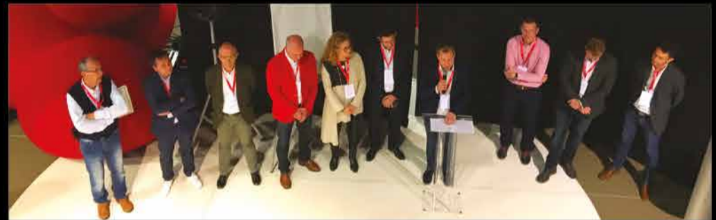
Workshop sur l'emploi + d'infos sur : www.facebook.com/pg/MadeinJuraAsso

R.E.I. INDUSTRY A ÉTÉ DÉTECTÉE PAR L'AGENCE AU COURS DES RENCONTRES D'AFFAIRES DE BOURG-EN-BRESSE EN 2016. BIEN QU'ELLE AIT ACCÈS À DES MARCHÉS À EDF HYDRO, L'AGENCE CONTINUE À SUIVRE R.E.I. INDUSTRY CAR SON ACTIVITÉ LIÉE AU RÉEMPLOI EST ATYPIQUE ET PROMETTEUSE. APRÈS L'AVOIR PRIMÉE EN 2017 AU TROPHÉE DÉVELOPPEMENT DURABLE DES TROPHÉES DE L'ENTREPRISE DU PROGRÈS DE L'AIN, L'AGENCE S'ASSOCIE DÉSORMAIS À LA CO-CONSTRUCTION DES « DÉFIS RÉEMPLOI » AFIN DE CONVAINCRE LES INDUSTRIELS DU POTENTIEL DU RÉEMPLOI, POUR LEUR PERFORMANCE INDUSTRIELLE ET POUR L'ENVIRONNEMENT !