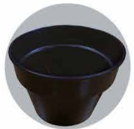
Exemples de réalisations