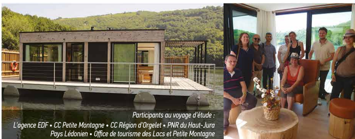
Participants au voyage d'étude : L'agence EDF • CC Petite Montagne • CC Région d'Orgelet • PNR du Haut-Jura Pays Lédonien • Office de tourisme des Lacs et Petite Montagne